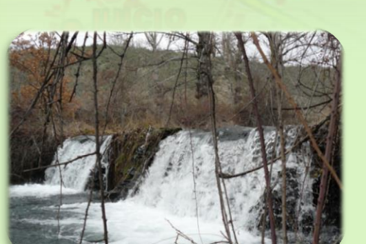
Antiguo lavadero cubierto (izquierda) y represa de pizarra para riego (derecha).