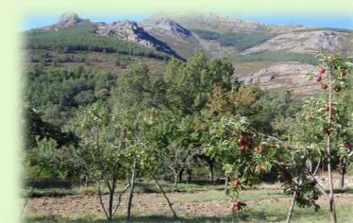
Parcelas de cultivos frutales.