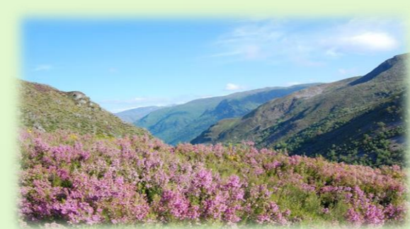
Mielada, el período de floración de las distintas plantas melíferas.

Puntos de interés: las ruinas del antiguo batán, la biodiversidad y los colmenares.