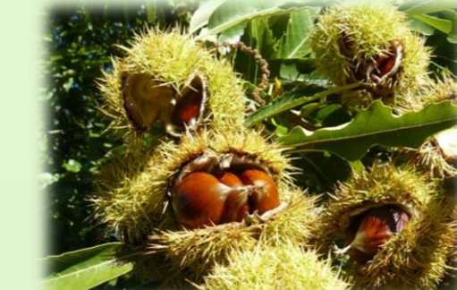
Hojas largas y aserradas del castaño con sus flores.